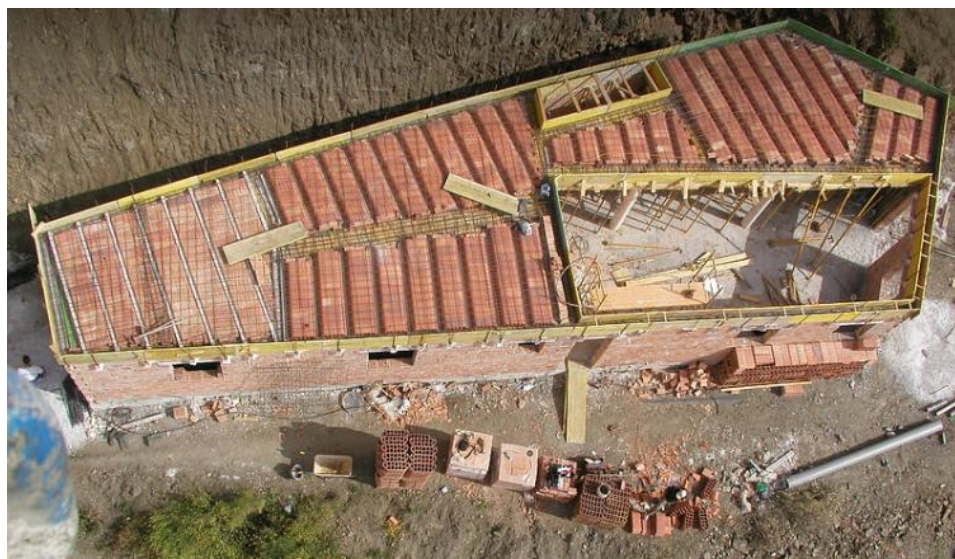
Finca Isabel begynder at tage form. Siden billedet blev taget, er der bygget soveværelse på førstesalen, der er kommet vindue i badeværelset, installeret sanitet og støbt terrasser.

■ Naia Bang / Texthuset Aalborg